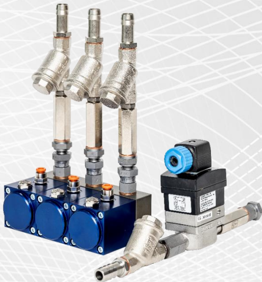
(Abb. Mischeinheit für drei Lösemittel und Inline-Durchflusssensor)

Verbrauchs- und Durchflussmessung / Mischen von verschiedenen Lösemittel