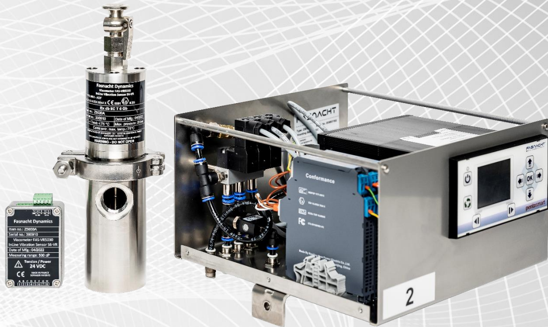
(Abb. Vibrations-Viskosimeter mit Steuereinheit PentaSmart verbaut und verdrahtet in Montagebox aus Edelstahl).

Automatische Kontrolle der Viskosität und Temperatur basierend auf dem Vibrations Messprinzip